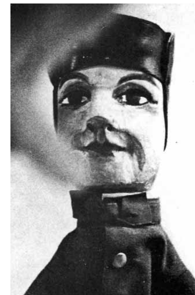
El Guiniol de Gastón Baty (años 1930)

ra y estructuró su teatrito creando una terminología propia que todavía hoy perdura en el gremio. No lo hizo él solo, claro, pero sí acorde a su filosofía. Es así que el que interpreta a Guiniol dice "hacer de Lorenzo", en su recuerdo, o "hacer de Rosa" para los papeles de mujeres (Madelón y Luisita) en memoria de su hija Rose-Pierrette, titerista que murió joven. Y, si antes hemos visto la palabra "castelet", hay más tecnicismos inventados para designar los distintos elementos del castillejo, el cual es mucho más elaborado que los teatritos parisinos. Sabemos, además, que Mourguet se nutrió, gustoso, de las hablas, hoy inexistentes, de la región lionesa, franco-provenzales casi todas. Pues siendo buhonero recorría los pueblos de la montaña y de la hondonada cercanas, huyendo quizás de la urbe de notables de alto copete que siempre ha sido Lyon. Así aprendió estas hablas para comunicar mejor con los lugareños durante sus espectáculos de charlatán... Transmitió su amor por el verbo que se hacía carne de miseria rural que luego llegaba a Lyon en forma de