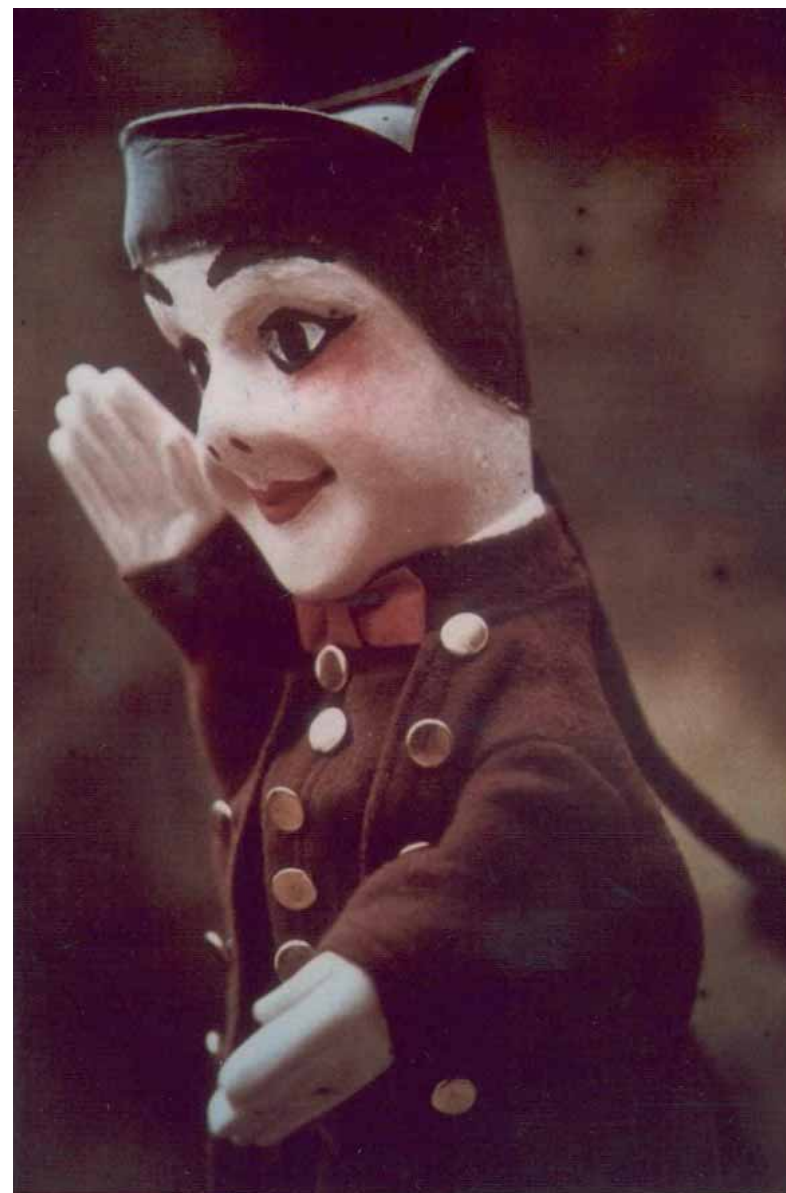
El Guiniol de Federico Jossierand (años 1920).