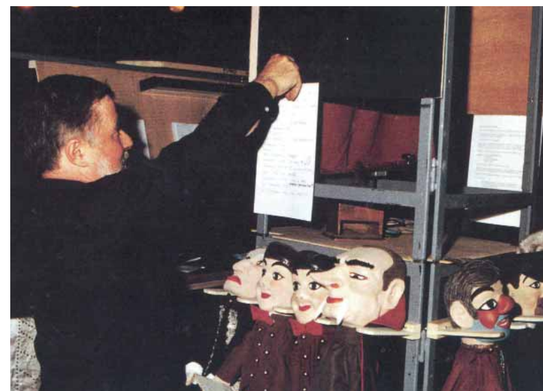
Dentro de un castillejo.

dedicando su vida al buratino que llamaremos títere sin más, porque decir títere de guante es muy largo. El origen de esta palabra castellana es puramente físico, una onomatopeya genial del comi-castro que antiguamente le servía, en la plaza, para el ejercicio de una profesión sublime: atraer a un público, casi siempre del “pueblo de abajo”, para divertirlo y hacerle reír. Pues, si en Italia el término “burattino” proviene de la materia textil que viste el muñeco, esa borra con la que se confeccionaba las burdas telas de los harapos proletarios, en España, el término nos remite a nuestra condición de animal y su voz primitiva, tíiii-ti-ti-ti-tíiii-teeres, damas y caballeros!!! , es un grito de supervivencia que nos libera por un instante de todo corpus literario y nos exime, si acaso, de los desafueros que propala una sociedad alfabetizada dada. Este tipo de espectáculos es mucho más infrecuente en España o Francia que en Italia. Abundan, en efecto, en la literatura titerera italiana los sentidos testimonios –de agrios críticos teatrales a veces– recordando momentos disfrutados en un cruce de calles de cualquier pequeña ciudad donde un cómico anónimo, rodeado de espectadores, improvisaba