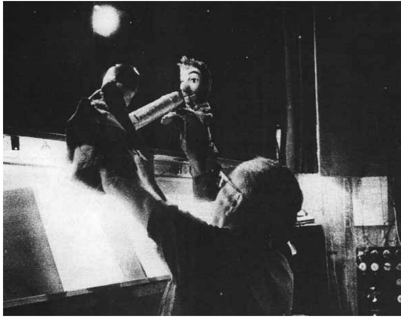
Guiniol y Niafrón desde dentro.

una obrita de cachiporra protagonizada por campesinos, ladrones y policías, en la que más de una vez ganó el ladrón o el glotón con el beneplácito del público muerto de risa; todo ello en una baracca o casotto rudimentarios, todo ello expresado en un italiano precario, apenas perceptible por la falta de léxico o por los términos dialectales que abundaban en los diálogos. La marioneta, en cambio, tiende a la mudez y se mueve de arriba a abajo. Es más visual y refinada, más virtual y, a la diferencia de los teatrinos de buratinos, no suele hacer intervenir al público –un público que suele ser más culto. Si aquéllas suelen exhibir, los títeres más bien invitan a la interacción y a la participación del espectador en el espectáculo. El teatro de marionetas, en definitiva, tiende más hacia la pantalla de cine o de televisión que hacia un evento teatral, pues no anhela el encuentro colectivo entre personajes y público, sino el goce a distancia del espectador. Aparte de Italia, encontramos marionetas un poco en todas partes de Europa: el Cristobica andaluz en España, o en algunas regiones del norte de Francia, en particular en Picardía