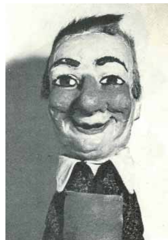
Niafrón de la Compañía Josserand-Vuillerme, años 1860-70.