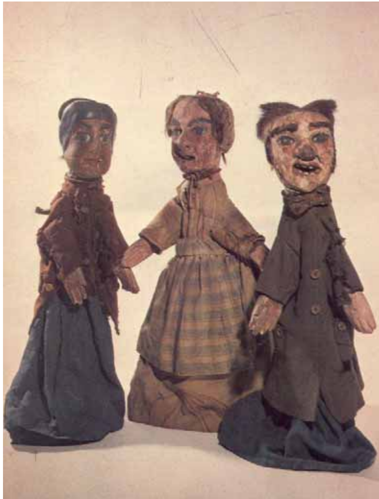
Los tres muñecos de Lorenzo Mourguet.