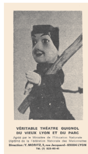
Un Guiniol de los años 1970.

viejo y céntrico Lyon. El estallido de la revolución supuso una fuerte convulsión social y política entre la multitud de canusos de la Brumosa, ya que no se puede hablar en Francia del obrero de la seda fuera de Lyon prácticamente. En todo caso, sabemos que muchos eran, hasta 1789, los canusos dispuestos a soportar meses y meses de paro y pobreza con tal de no renunciar a su noble oficio. En este contexto hay que situar a Lyon, que dio lugar a un nuevo término revolucionario, “mitrailades”, para referirse a los cientos y miles de disparos que acabaron con la vida de los oponentes blancos a la revolución que liberó a Lyon llamándola: Comuna liberada, Commune Affranchie .