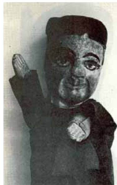
Guiniol de viaje, usado en las giras por la región (fines de s. XIX)