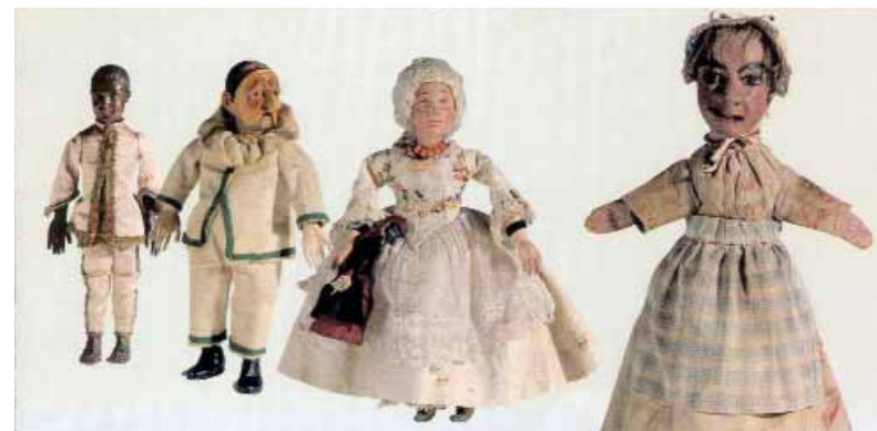
La Madelón de Lorenzo Mourguet junto a otros títeres del Museo de Gadagne.

París, tal y como lo alimenta la leyenda centralista que, paradójicamente sitúa su surgimiento en 1795 en Lyon, es decir, en plena república “termidoriana”, o sea, reaccionaria. Leyenda que no lo ha relacionado aún con el viejo término, tan francés y tan republicano, de argot de oficio que hemos explicado más arriba. Lo que podemos afirmar es que la primera alusión de las autoridades nacionales al teatro lionés surge en noviembre de 1852, en el decreto de Napoleón III que impuso una censura sobre los títeres lioneses –y sólo sobre los lioneses. En este decreto, no se mencionan “los guiñoles” sino los “théâtres à la Guignol”, una curiosa expresión que viene a decir: “teatros con guindaleta”, “teatros de la guindaleta” o “teatros al estilo de la guindaleta”. Sería muy instructivo hacer un estudio profundizado de esta expresión insólita que feminiza el presunto nombre propio “Guignol”, restituyendo, en realidad, lo repetimos, un antiguo vocablo de jerga obrera: la guignole . Por otra parte, lo que también podemos asegurar es que Guiñol, en París, está siempre unido –por no decir atado de pies y manos– a Polichinela, en todas sus vertientes, en particular en las que más deplora el periodista de la Décade que citamos al inicio de este capítulo. En fin, es significativo que esta censura imperial coincidiera con la publicación de un libro del erudito Carlos Magnin: una historia europea de los títeres que sí nombra los Guiñoles “de hace veinte años” en una lacónica arenga dirigida a